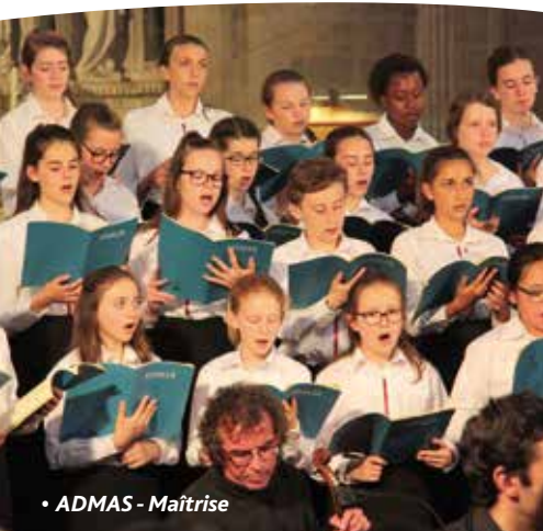
• ADMAS - Maîtrise