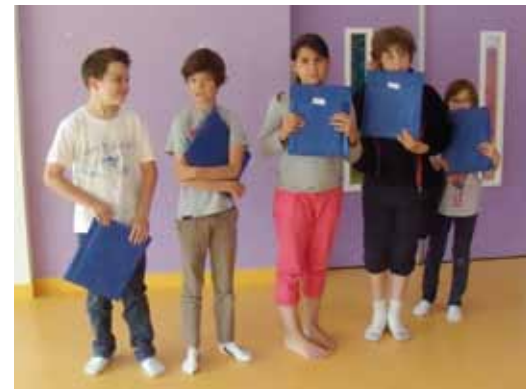
• Les vainqueurs de l'école du Cheval Blanc

Chaque lauréat a reçu un livre offert par la Mairie. Cette année, il n'y a pas de gagnant au niveau départemental.