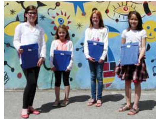
• Les gagnantes de l'école Sainte-Anne