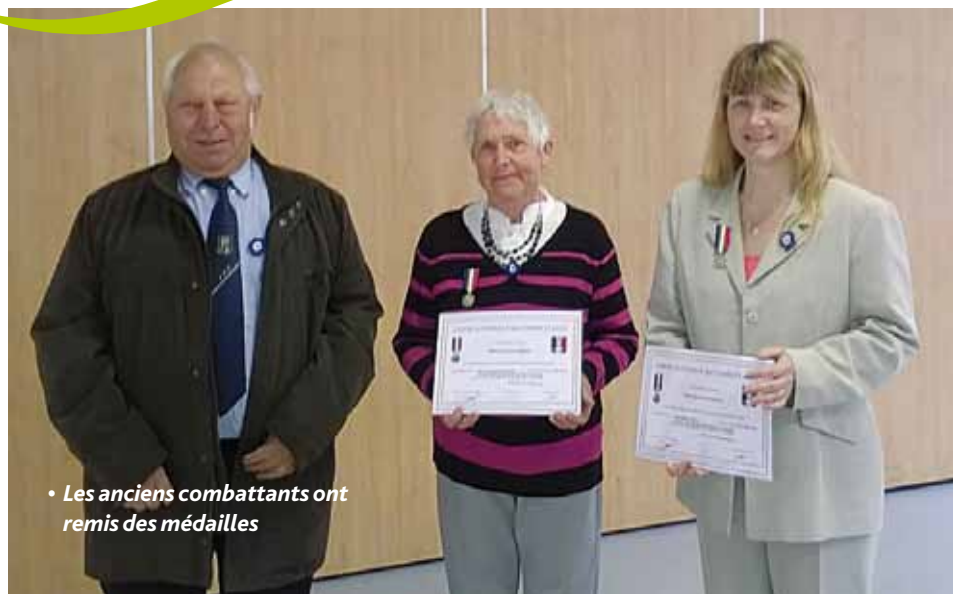
• Les anciens combattants ont remis des médailles