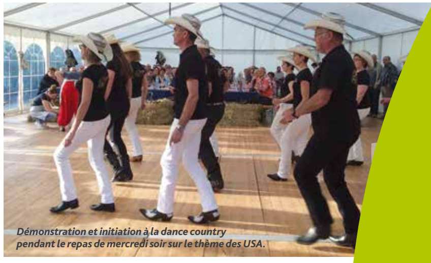
Démonstration et initiation à la danse country pendant le repas de mercredi soir sur le thème des USA.