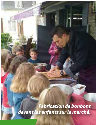
Fabrication de bonbons devant les enfants sur le marché.