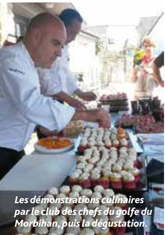
Les démonstrations culinaires par le club des chefs du golfe du Morbihan, puis la dégustation.