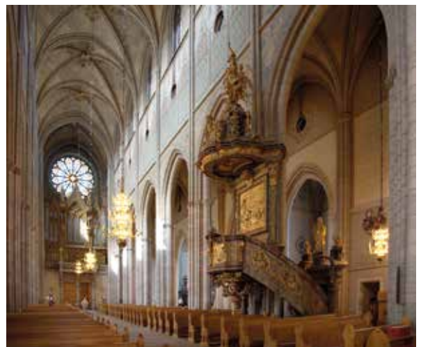
• Intérieur de la Cathédrale d'Uppsala

DIMANCHE 5 AVRIL : Messe des Rameaux à 11h / Concert à 17h