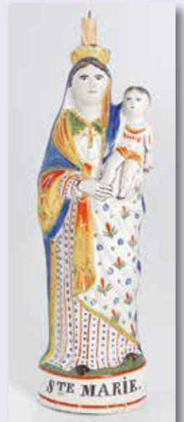
• Vierge d'accouchée, collections de Sainte-Anne-d'Auray

Pour être au courant de toutes nos activités, abonnez-vous à notre page Facebook : @Académie de Sainte-Anne d'Auray.