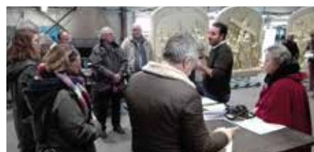
• Dans l'atelier Forge Déco Ouest