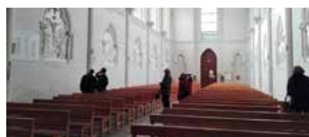
• Intérieur de l'église Saint-Rémy-en-Mauges