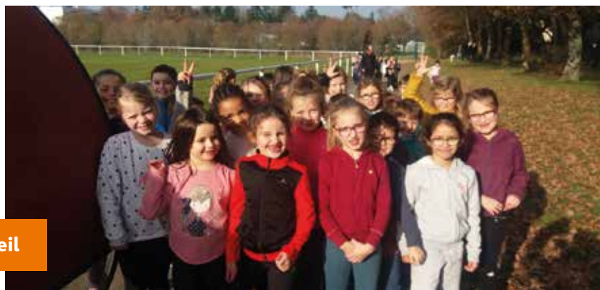
Téléthon 2019 sous le soleil