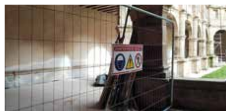
• Travaux cloître © Fondation Louis CADIC

Cette rencontre a également été l'occasion de découvrir la première édition du Chemin de croix, dans l'église de Saint-Rémy-en-Mauges. Les quatorze stations en plâtre sont présentées de part et d'autre de la nef, dans des cadres bien différents que ceux du Chemin de croix de Sainte-Anne-d'Auray.