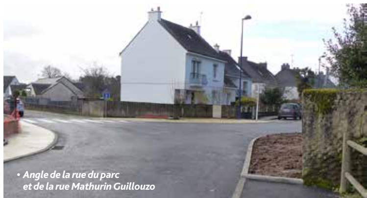
• Angle de la rue du parc et de la rue Mathurin Guillouzo

La réalisation du cheminement piéton de la route de Kerwinduc se fera sur la même période.